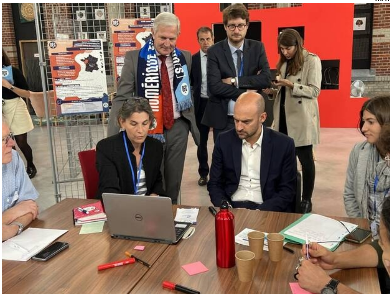
Lors de l'événement Numérique en communs 2022, à Lens, en septembre, le ministre chargé de la transition numérique, Jean-Noël Barrot, s'est montré intéressé par l'innovation d'Aciah.